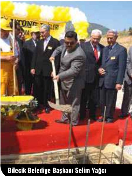
Bilecik Belediye Başkanı Selim Yağcı

konutlar yapılarak, halkımızın hizmetine sunulacaktır." dedi. Genel Müdür Nabi ÖZDEMİR'in ardından kürsüye gelen Bilecik Valisi Musa Çolak, sözlerine Bilecik'te gerçekleşen bu büyük yatırımdan ötürü YTONG'u kutlayarak başladı. Bilecik'in son yıllarda bir sanayileşme sürecine girdiğini belirten Çolak, hızla artan yatırımların Bilecik'i ekonomik yönden tam bir cazibe merkezi haline getirdiğini söyledi. Çolak, Bilecik YTONG Tesisleri ile ilgili olarak ise; "YTONG'un buraya kuracağı fabrikayı önemsiyoruz. Bu yatırımla birlikte ilimizde istihdam artacak, üretim ve ekonomi daha da gelişecektir." dedi. Bilecik Valisi Musa Çolak son olarak tüm sanayicileri Bilecik'e yatırım yapmaya davet etti.