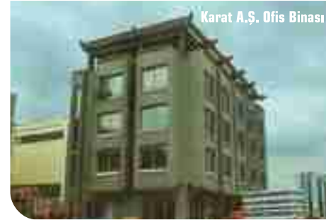
Karat A.Ş. Ofis Binası

saha betonlamasını ise donatılı olarak döktük. Dış duvarlarında da YTONG donatı panellerini yatay olarak uyguladık. Gerekli sıkıştırmaları yaparak, tekniğine uygun imalatlar yaptık. Kalfa değil mimarım! Ofis binası ise çok katlı olduğundan ve arazide yüksek dolguya rastlandığından sağlam zemine kuyular açılarak inilmesine ve üstüne radye temel oturtularak yapının yapılmasına inşaat mühendisi ile birlikte karar verdik ve uygulamaya başladık. İşveren bu kararımıza karşı çıktı. "Çevrede çok ofis binasının yapıldığını, hiçbirinde böyle bir uygulama yapılmadığını ve benim maliyeti artırmak adına bu imalatları yaptığımı bunlara gerek olmadığını" söyledi. Ben de "teknik bir kişi olarak, böyle bir zeminde yapılması gereken teknik uygulama neyi gerektiriyor ise onu yaparım, sizin istediğinizi yapamam, siz de böyle bir imalat istiyorsanız neden işi bana verdiniz, herhangi bir kalfa da