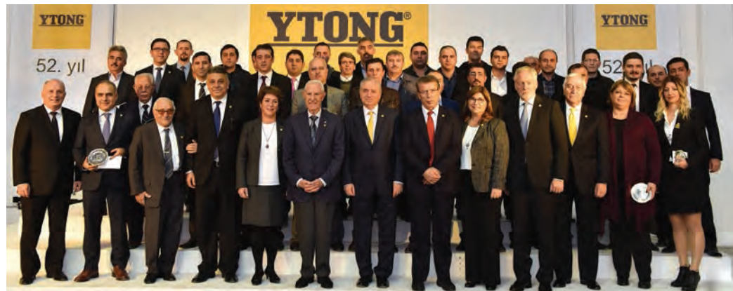
Ytong'a hizmet veren çalışanlara kıdem ödülleri verildi - Pendik Tesisi

yüksek performanslı yeni bir teknoloji ile kavuşması için altyapımızı yenileme çalışmalarını başlattık. Yenilikçi anlayışımızı üretim süreçlerimize de yansıtarak, enerji