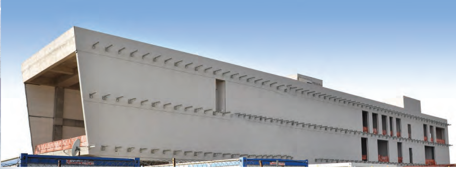
Uygulayıcı firma, Türk Ytong Yetkili Satıcısı Demiryürek İnşaat

Doları tutarında kredi kullanılarak, 1 milyar 245 milyon Amerikan Doları yatırımla 55 ayda tamamlanacak. Proje, Avrupa'dan 4 adet finansman ödülünün yanı sıra çevre ve sosyal uygulamalar konusunda da EBRD tarafından verilen 1 adet çevre ödülü aldı. Ayrıca proje, mühendislik ve tünelticilik alanında dünyanın en saygın kuruluşları arasında yer alan ITA Uluslararası Tünel ve Yeraltı Yapıları Birliği tarafından Büyük Projeler dalında Yılın Projesi Ödülü'ne layık görüldü. Boğaz geçişi tüneline sadece bu projeye özel olarak tasarlanan TBM (Tunnel Boring Machine - Tünel Kazma Makinesi) kullanıldı. Anadolu yakasından başlayan tünel inşaatı, Tünel Kazma Makinesi'nin deniz tabanının yaklaşık 25 metre altından toprağı kazarak ve iç çeperleri oluşturarak ilerlemesi sonucunda Avrupa yakasında tamamlandı.