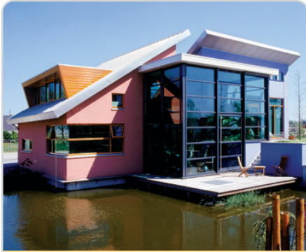
Almanya'da tümüyle Ytong ürünleri ile inşa edilmiş bu pasif ev, gerek malzeme seçimi gerek enerji tüketimi ile çevre dostu inşaatla iyi bir örnek.

Türkiye'ye özgü çalışmaların tetiklenmesi ve yeni yapılacak binalarda bu prensiplerin uygulanmasını teşvik etmek de derneğin hedefleri arasında.