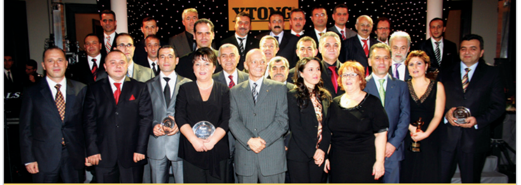
Gecede Ytong'a uzun yıllar emek veren çalışanlar ile "Yılın örnek çalışanları" ödülleri aldılar.

Y arım asra yaklaşan geçmişine büyük başarılar sığdıran ve büyümesini hız kesmeden sürdüren Türk Ytong, 44 yılı geride bıraktı. 14 Aralık'ta kutlanan "Kuruluş Yıldönümü" Ytong Pendik fabrikasında gerçekleştirilen törenle start aldı. Törende, Ytong'a uzun yıllar emek veren kıdemli çalışanlara plaketleri sunuldu ve yaşamını yitirmiş olan Ytong emektaşları da saygıyla anıldı. Kutlamalar aynı akşam Adile