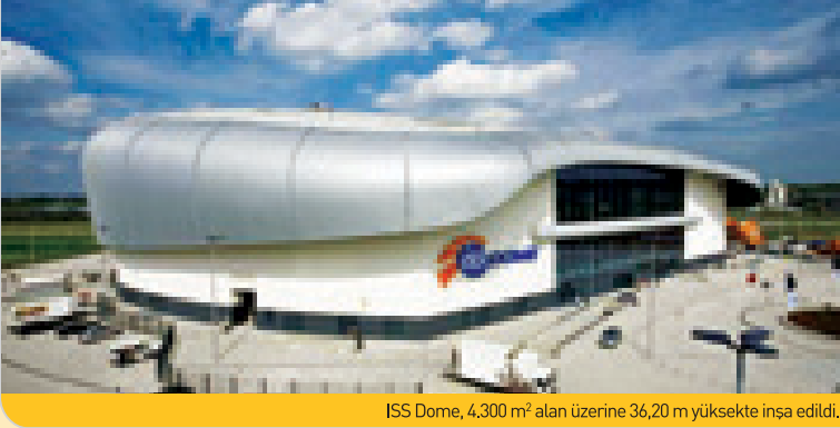
ISS Dome, 4.300 m 2 alan üzerine 36,20 m yüksekte inşa edildi.

Almanya Düsseldorf'ta 4.300 m 2 alan üzerine inşa edilen devasa "ISS Dome" kapılarını ilk kez 2006 Eylül'ünde açtı. Alman RKW - Rhode Kellermann Wawrowsky tarafından tasarlanan bu çok amaçlı salon, Ytong donatılı elemanları kullanılarak 19 ay gibi rekor bir sürede tamamlandı.